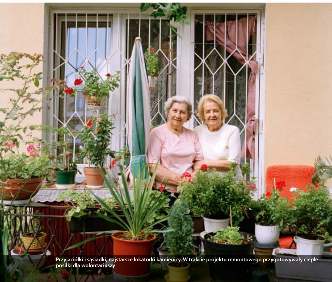
Przyjaciółki i sąsiadki, najstarsze lokatorki kamienicy. W trakcie projektu remontowego przygotowywały ciepłe posiłki dla wolontariuszy

Przy dużych projektach, jak np. w Gliwicach (dom dla 23 rodzin) na stałe są zatrudnione trzy osoby – kierownik budowy i dwóch majstrów – co powoduje