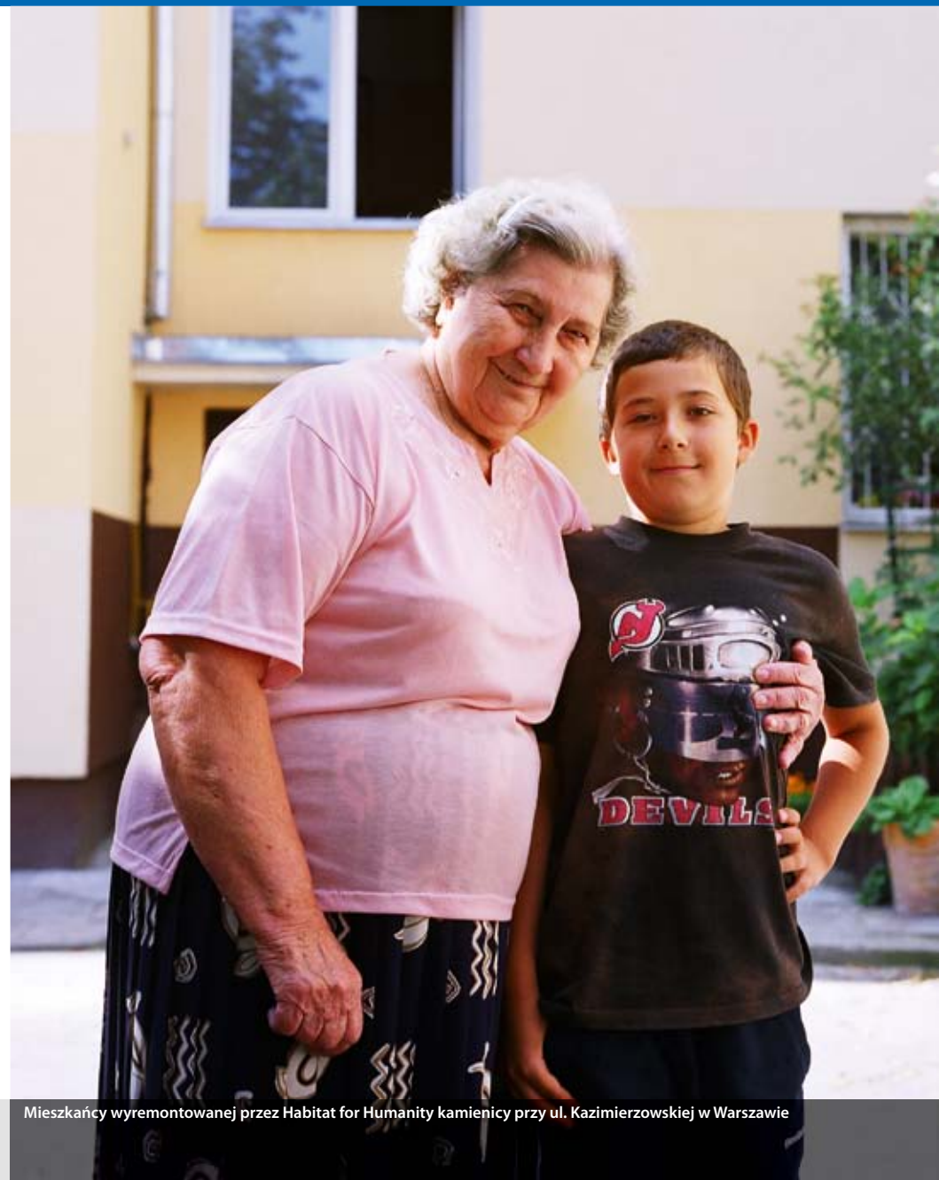
Mieszkańcy wyremontowanej przez Habitat for Humanity kamienicy przy ul. Kazimierzowskiej w Warszawie

swoich stronach internetowych członkowie wspólnoty (bo tym jest Fundacja) napisali: „Wierzmy, że bezpieczne i dostępne finansowo mieszkanie jest jednym z zasadniczych praw człowieka, a także podstawowym składnikiem godności i trwałej pomyślności każdego mieszkańca naszego globu. Z tym przekonaniem budujemy odpowiednie i trwałe mieszkania dla osób potrzebujących”. Habitat wyrosła z chrześcijańskiej – ściślej luterańskiej – tradycji i dlatego tak organizuje pomoc dla potrzebujących, że wokół budowli tworzy wspólnoty ludzi i instytucji, które przekazują pieniądze, dary, ale przede wszystkim poświęcają swój czas. Na stronie www.Habitat przekonuje: „Wierzmy, że [...] wszyscy mogą się jednoczyć, służąc osobom potrzebującym; oraz że każdy może wnieść swój wkład w dzieło budowy domów i nadziei”.