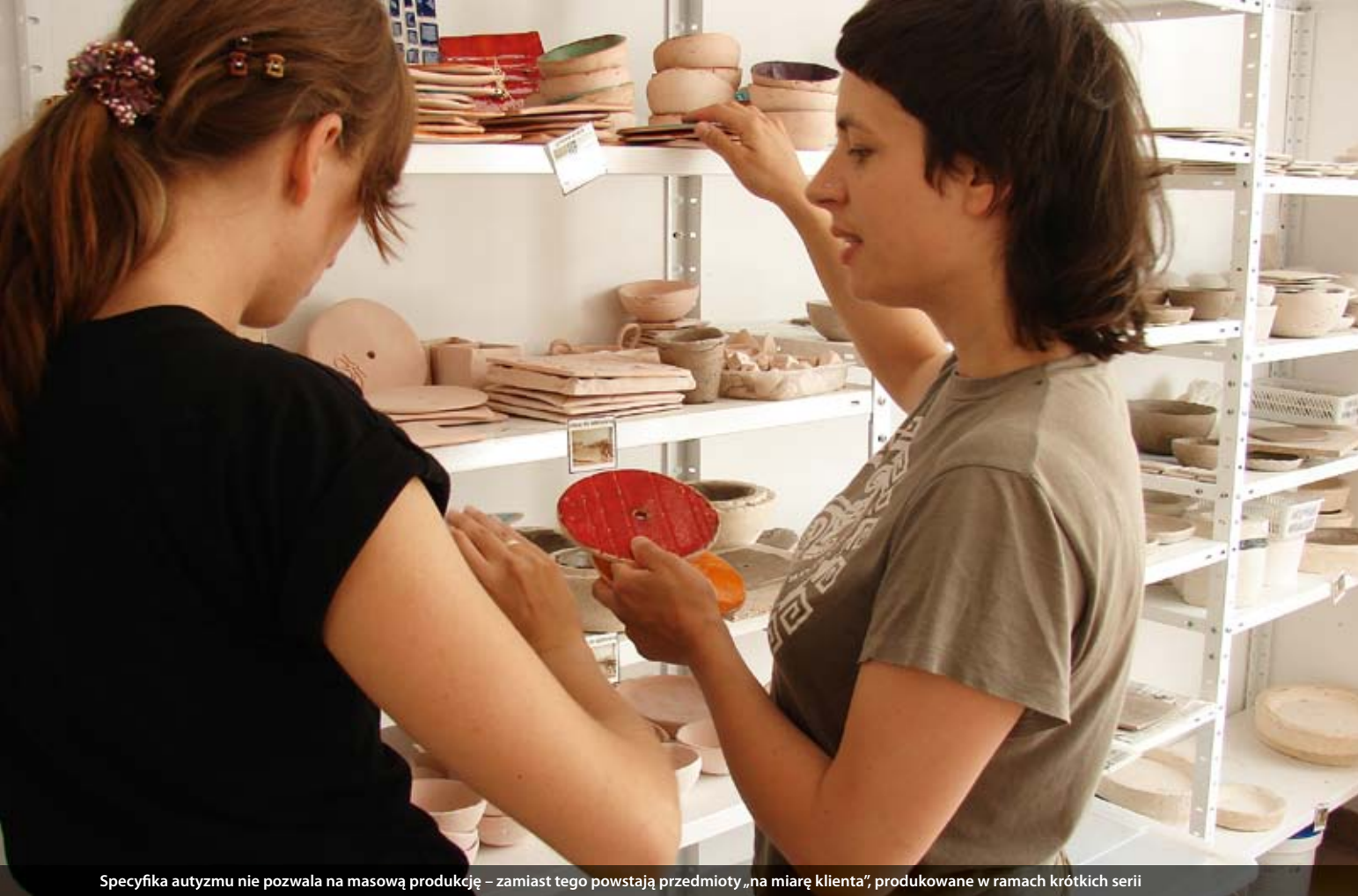
Specyfika autyzmu nie pozwala na masową produkcję – zamiast tego powstają przedmioty „na miarę klienta”, produkowane w ramach krótkich serii

Pracownia ma też zagranicznych partnerów, w myśl zasady: „Im więcej sojuszników tym całość jest silniejsza, bardziej wiarygodna i bliższa”. Ta współpraca jest integralną częścią projektu. Partnerstwo tworzą organizacje pomagające osobom z autyzmem, ale także te, które działają na rzecz osób z dysleksją i niejęzykowymi trudnościami w uczeniu się (NLD) z Belgii,