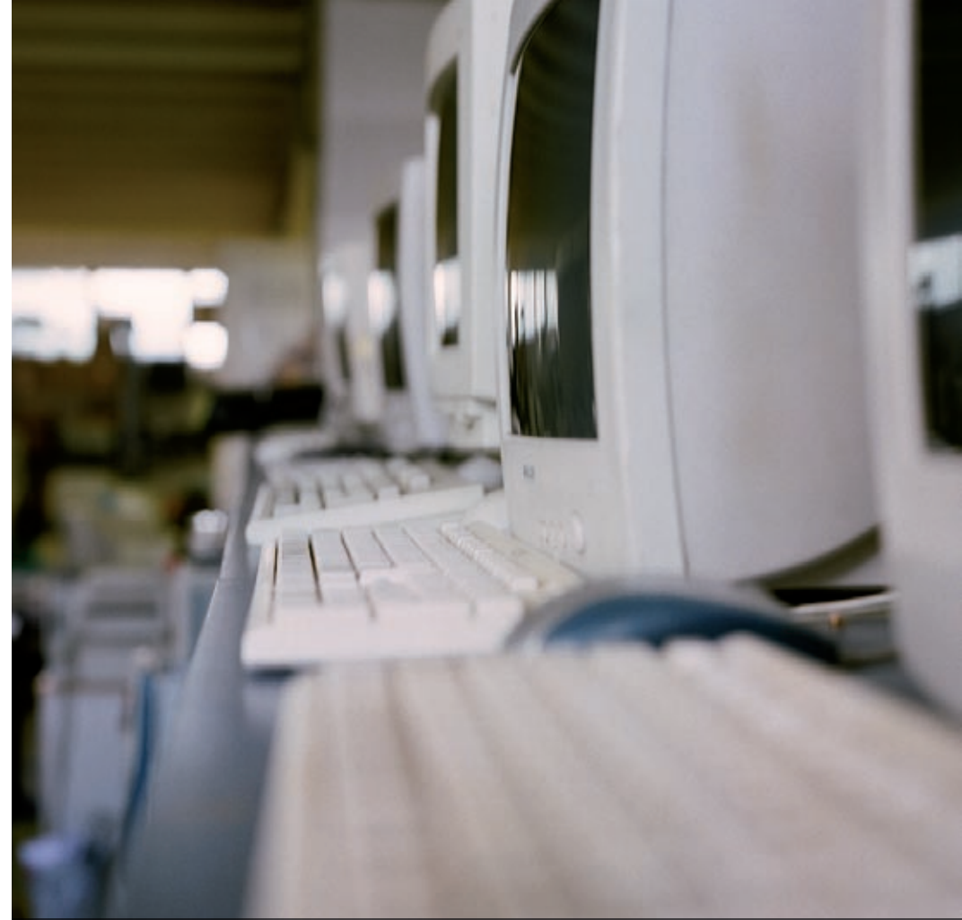
Komputery, komputery, komputery – zajmują cały magazyn BDR

Serwis powstał, aby umożliwiać osobom prywatnym przekazywanie używanych, ale wciąż sprawnych rzeczy organizacjom i placówkom non-profit z całej Pol-