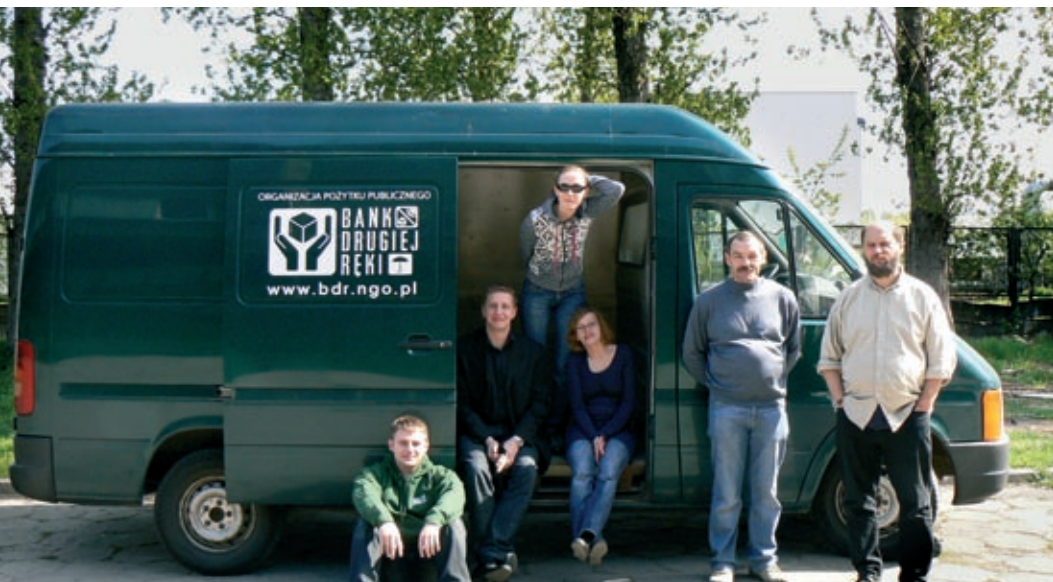
Zespół pracowników BDR

Organizacje pozarządowe i placówki non-profit (w zależności od programu).