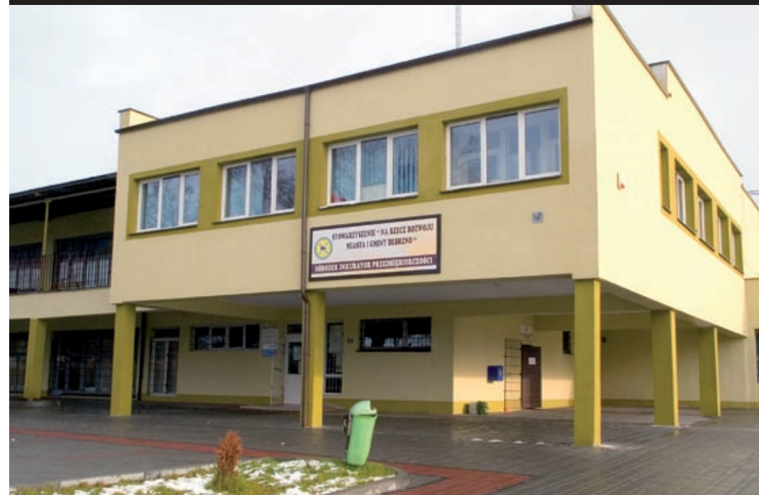
Ośrodek/ Inkubator Przedsiębiorczości – siedziba i największa duma stowarzyszenia