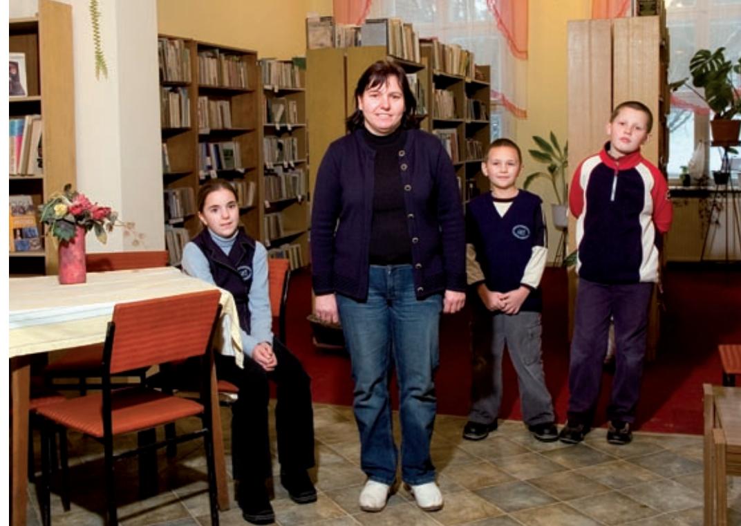
Pałac w Starym Gronowie – efekt i modelowy przykład pobudzania aktywności lokalnej

W inkubatorze lokowały się firmy zakładane przez osoby bezrobotne za pożyczki z urzędu pracy, m.in. piekarnia, zakład fryzjerski, kawiarenka.