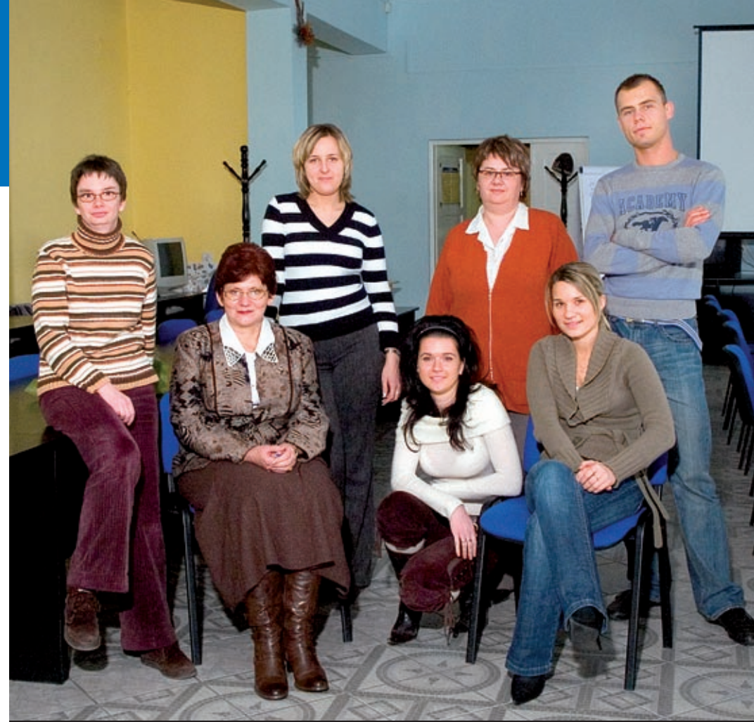
Zespół stowarzyszenia – jego największy potencjał

lub zakładanie własnych firm. Przykład miasta i gminy Debrzno pokazuje, jak można zmienić gminę, jeśli zawrze się społeczne porozumienie organizacji, instytucji i ludzi, godząc sprzeczne interesy i wspólnie pracując nad rozwojem „małej ojczyzny”.